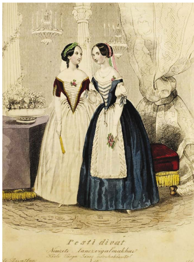
Pesti divat a nemzeti táncvigalmakhoz (Pesti Divatlap, 1845)

BUDAPEST HIRLAP – Budapest, Martius 11. 1856. (59. szám melléklete: 60. oldal)