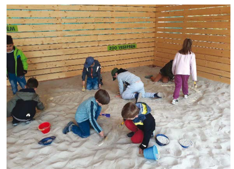
(Készítette: Kupiné Böcsödi Ildikő)