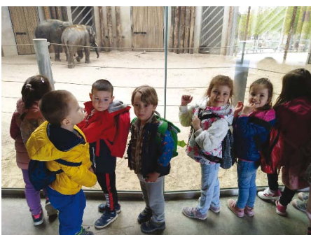
(Készítette: Mészárosné Giricz Marianna)