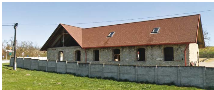
Az egykori baracska Nagypalota épülete napjainkban