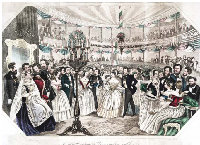
Védelyleti táncvigalom Pesten 1845-ben