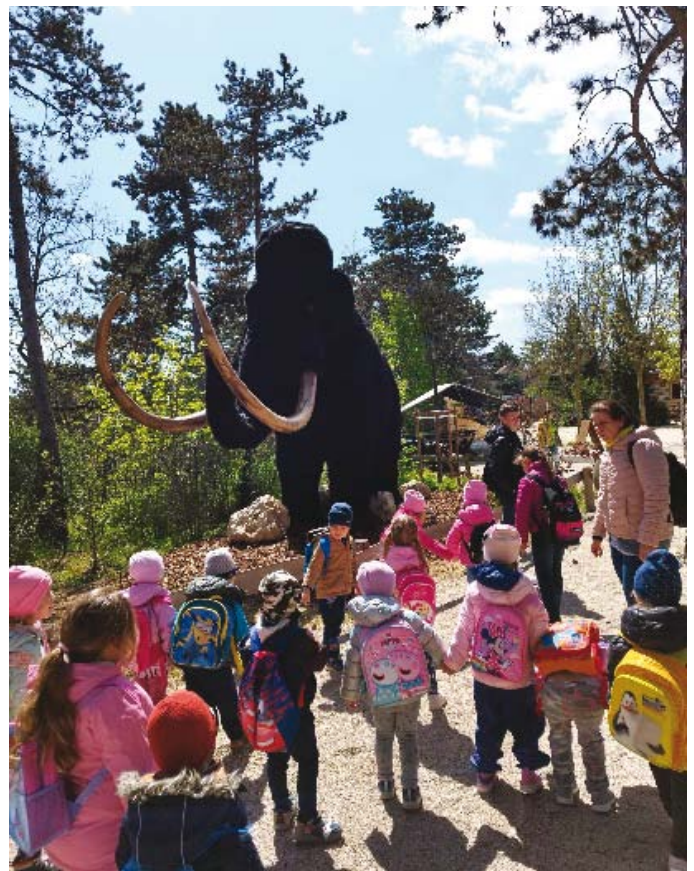
(Készítette: Ruzicska-Adorján Orsolya)