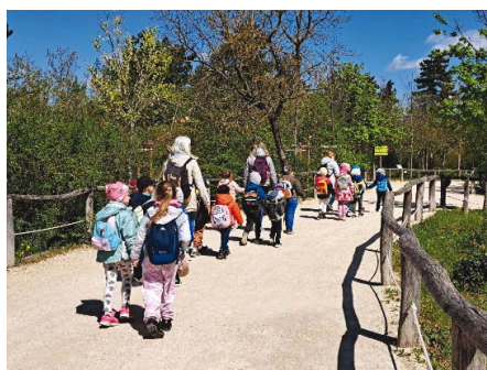
(Készítette: Kocsisné Varjas Alexandra)