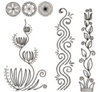
Díszítőmotívumok 19. századi népi jellegű fejfákról

templom, nem tudni, viszont a mai katolikus egyház névrokon elődje, a Mindenszentek bencés nemzetségi monostor 1212 táján valahol