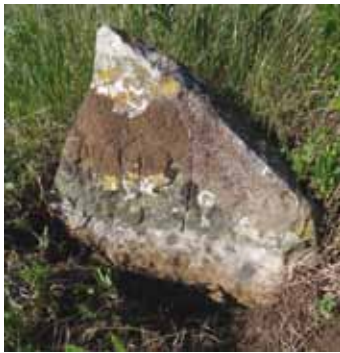
Terméskőből készült N.P.I. monogramos sírjel a 18-19. század fordulójáról

elhelyezkedése által elődjéhez képest kevésbé volt kitéve a tavaszi áradások szeszélyeinek. Keleti sarkában az izraelita sírkert kapott helyet, míg a szántóföld és temetői út határolta felső, Kápolnásnyék felé néző délnyugati sáv bővítés gyanánt vált a terület részévé 1940-ben. Noha a temető 1782-ben már megnyílt és az ekkor vezetni kezdett helyi református halotti anyakönyv alapján megtörténtek az első temetkezések is, a legkorábbi évszámú sírkövel jelölt hant csupán 1799-ből ismert. En-